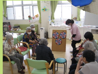
レクリエーション